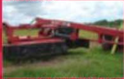
Faneur à foin Hesston 1340, 12 pi, pile centrale, giradine, rouleau fer et caoutchouc. Prix : 8800 $