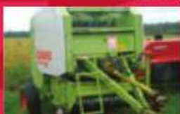
Presse Claas Rollant 46, presse à rouleaux, corde, 10 000 bulles. Prix : 5500 $