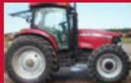
Case IH MX135, 2003, 1867 h, cab., moteur 6.7 Cummins, 4 v. à vide dbl., PTO 540/1000, 2 bras téles., a/c power steering, coffre à outils. Prix : 40 000 $