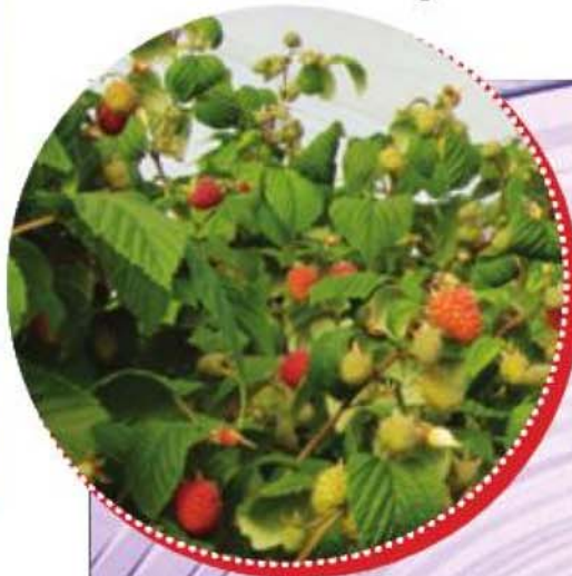
La framboise est la culture la plus répandue dans les grands tunnels de type multichapelle au Québec.

tichapelle, bien que moins dispendieuse, ne résistera pas à une importante chute de neige. Au Québec, cela signifie qu'on doit installer le plastique sur la structure de métal uniquement vers la mi-avril ou même la fin avril. Les régions plus nordiques doivent attendre en mai. Des producteurs ont parfois été surpris par une tempête et ont tenté de minimiser les dommages en chassant la neige à partir de l'intérieur des tunnels à l'aide de bâtons munis d'un bout rembourré. Cette solution n'est évidemment pas idéale et toute absence du personnel sur la ferme peut se révéler désastreuse. Sans chute de neige imprévue, la structure dure de 12 à 15 ans. ▶