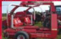
Eurobanneuse Individuelle Kverneland 7664, 2008, à bulles carrées et rondes. Prix : 54 000 $