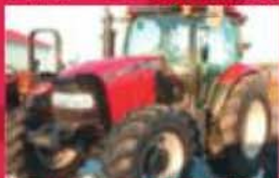
Case IH Maxxum 125, 2009, 234 h, cabine, a/c, trans.16x16, 4 remotes, pneus 20.8R38. Presque neuf. Prix : 75 000 $