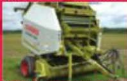
Presse à bulles rondes Claus Variant 240 Rotocat, 2002, rotocat, corde et filot, gros pick-up, moniteur, pneus 15-55R17. Prix : 14 000 $