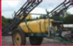
Arroseuse M-S T750, 2008, 5 sections de rampes Monah 75 pi, 3 jets, pompe centrifuge à PTO, 750 gal, pneus 390/70R38. Prix : 35 000 $