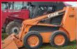
Chargeur à petits guidés Case 420, 2006, 117 h, bucket 60 po, block heater, flash, pneus 10x16.5, foot throttle. Prix : 22 000 $