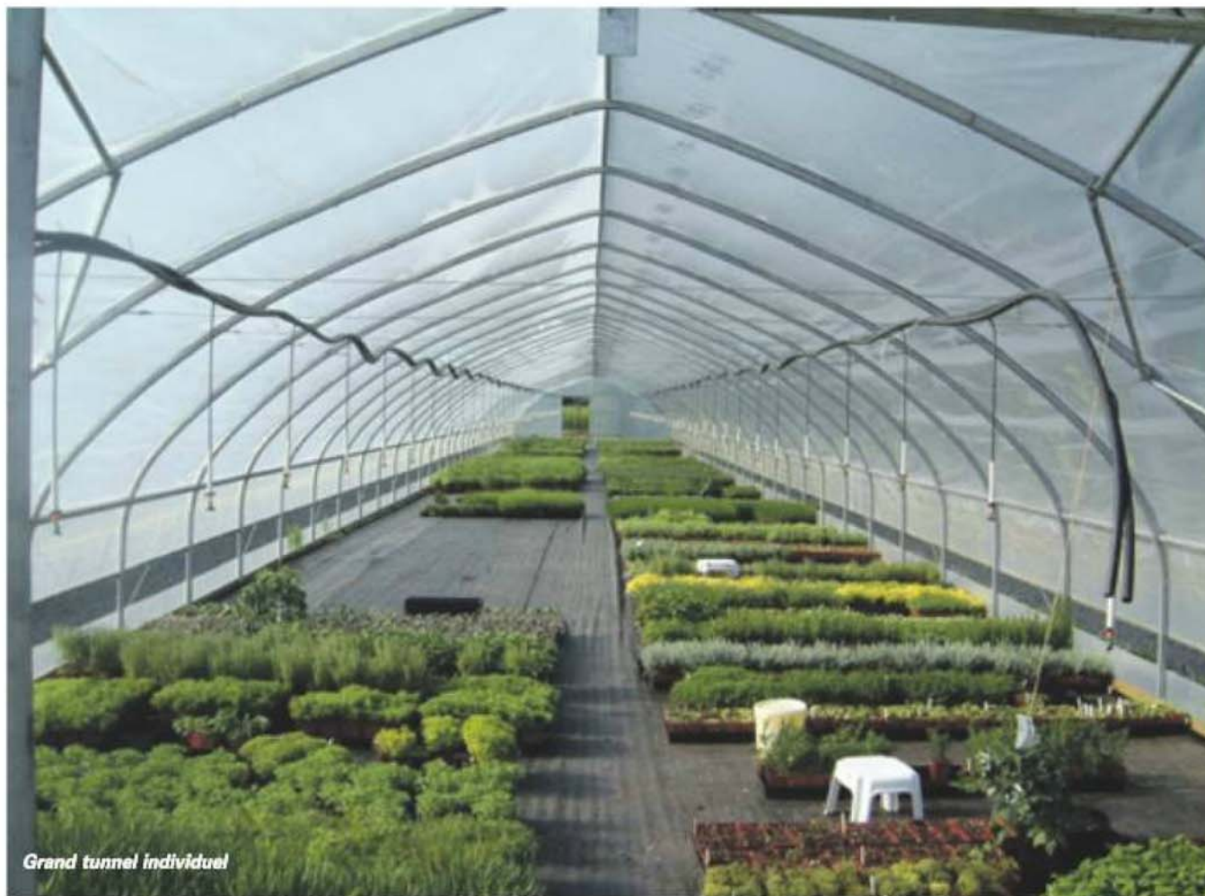
Grand tunnel individuel

ment de 24 h à 48 h après une bonne pluie et se situe entre 10 à 30 kilopascals (kPa). En grand tunnel, il faut viser 10 à 15 kPa de plus. Certains modèles de tensiomètres transmettent les données à distance et fournissent une analyse plus constante. Il faut à tout le moins prévoir un appareil divisé de 0 à 40 kPa pour obtenir une lecture assez précise. La vitesse de drainage des sols est très variable, mais on évalue les besoins à environ 6800 litres d'eau par semaine pour un grand tunnel standard de 10 mètres de large sur 30 mètres de long.