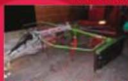
Râteau Claas 350T, relevage hydraulique, 10 bras. Prix : 4200 $