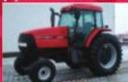
Tracteur Case IH MX100, 1999, 6000 h, cabine, a/c, 2RM, pneus 14.4R42, 3 valves. Prix : 35 900 $