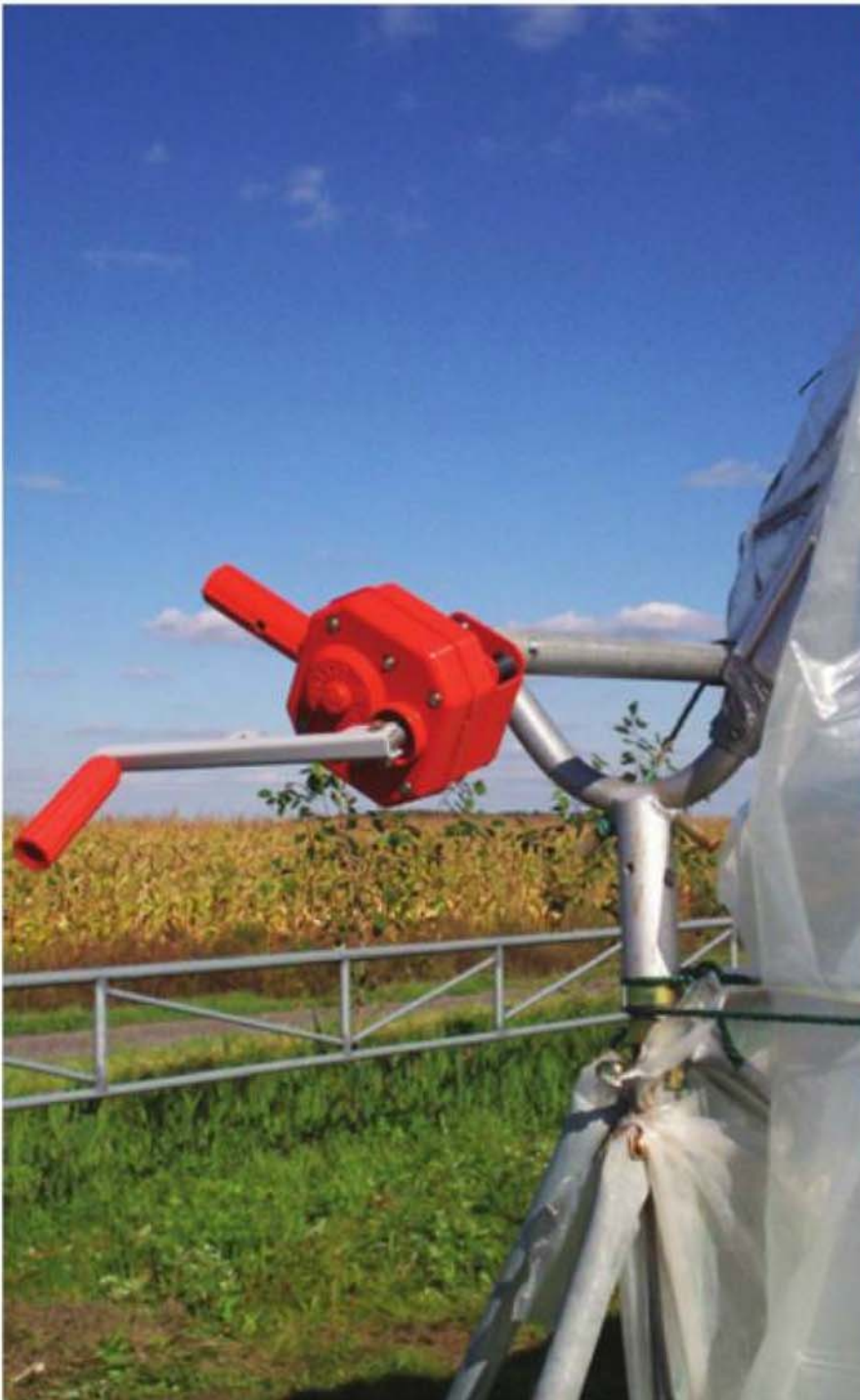
Il est essentiel de disposer d'un système d'ouverture mécanique afin de ventiler ou refermer les tunnels rapidement.

Il faut bien entendu irriguer les cultures en grand tunnel. « Plusieurs n'irriguent pas assez », met en garde Lewis W. Jett. L'agronome Daniel Bergeron, du MAPAQ, estime que l'irrigation en grand tunnel est plus difficile qu'en champ et que les besoins sont plus élevés. Un plant de fraise, par exemple, aura besoin de 30 % à 50 % plus d'eau. M. Bergeron conseille l'emploi de deux séries de tensiomètres, dont une au centre du rang et une autre à côté des plants. La combinaison des deux informations permet d'évaluer l'ampleur du cône souterrain réellement irrigué à un moment précis. Si seules les racines du centre sont irriguées correctement, on diminue le rendement potentiel des plants. Dans certains sols, deux lignes d'irrigation par rang sont parfois indiquées. L'état d'équilibre en fonction de la capacité d'absorption de l'eau du sol se mesure normale- ➤