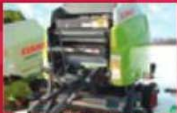
Presse à bulles rondes Claus 360 rotocat, 2008, corde et filot. Très propre. Prix : 14 900 $