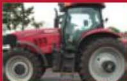
Case IH PUMA 210, 2008, cabine, 4x4, a/c, 1023 h, trans.19x6, full suspension, 4 sorties d'huile. Très propre. Prix : 105 000 $