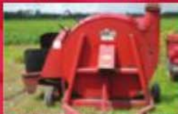
Souffleur à ensilage Case IH 600. Cercueu neuf. Prix : 5200 $