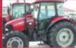
Tracteur Case IH JX95, 2007, 1100 h, cabine, a/c, 4RM, transmission 12x12, 2 remotes. Prix : 34 500 $