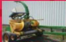
Fourrageuse John Deere 3940, pick-up à foin, nez à maïs 2 rangs, kit de préservatifs. Barre de coupe 1 m. Prix : 6500 $