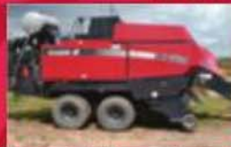
Presse à bulles carrées Case IH LHX331, 2003, tandem, rotocat, kit préservatifs auto, kit graissage. Prix : 49 000 $