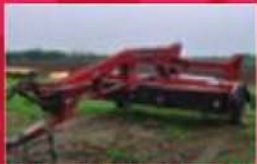
Fancheuse-conditionneuse Case IH 8312, 1995, conditionneur à rouleaux, pin type, largeur 12 pi, pile centrale. Prix : 9200 $