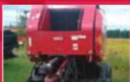
Presse Case IH RBX452, 2005, à corde, filot, moniteur, 5000 bulles. Prix : 14 900 $