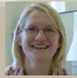
Directrice des opérations