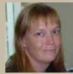
Directrice des opérations par intérim