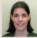
Chargés de projets