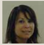
Chargés de projets