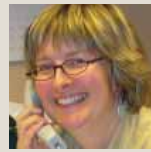
Bureau de projets