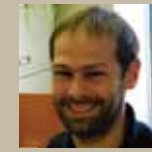
Service à la clientèle