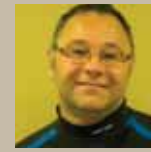
Marketing et affaires organisationnelles